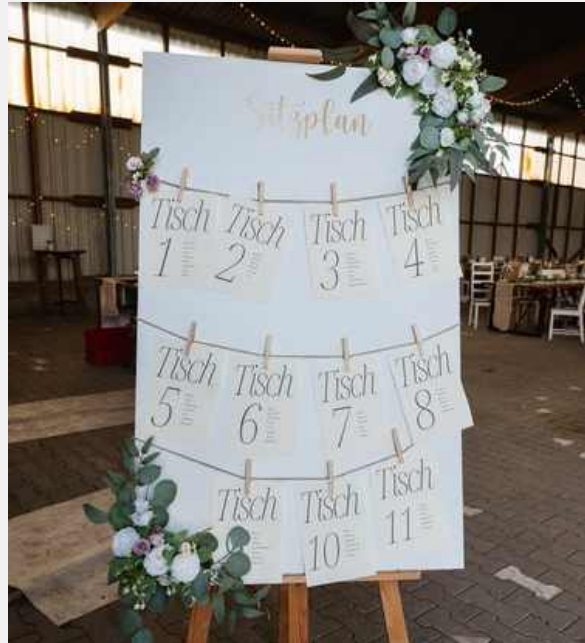
SITZPLAN BLUMIG FÜR 7-12 TISCHE