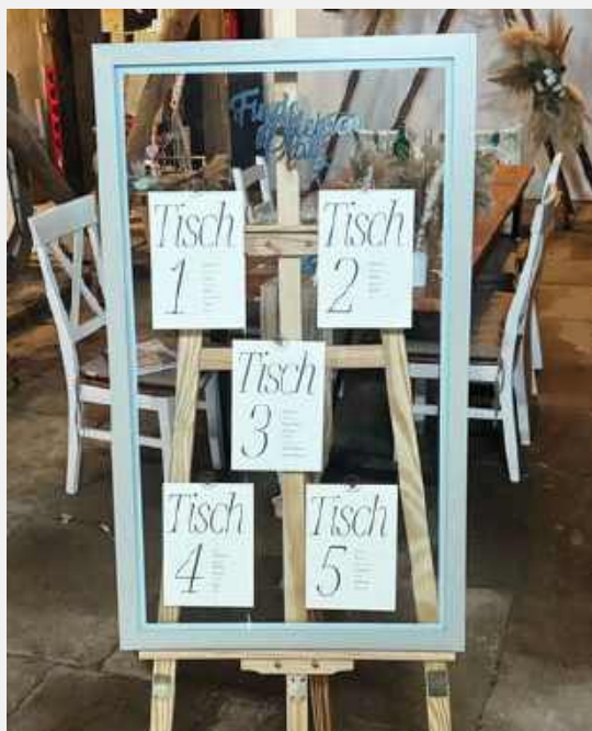
SITZPLAN GLÄSERN FÜR 4-5 TISCHE