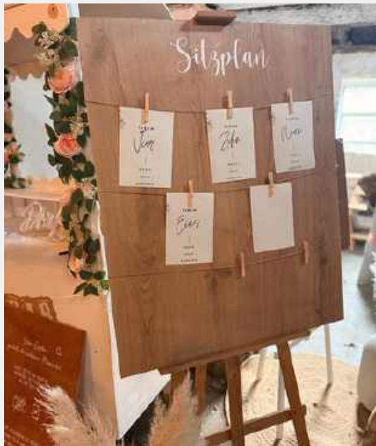
SITZPLAN BRAUN FÜR 6-9 TISCHE